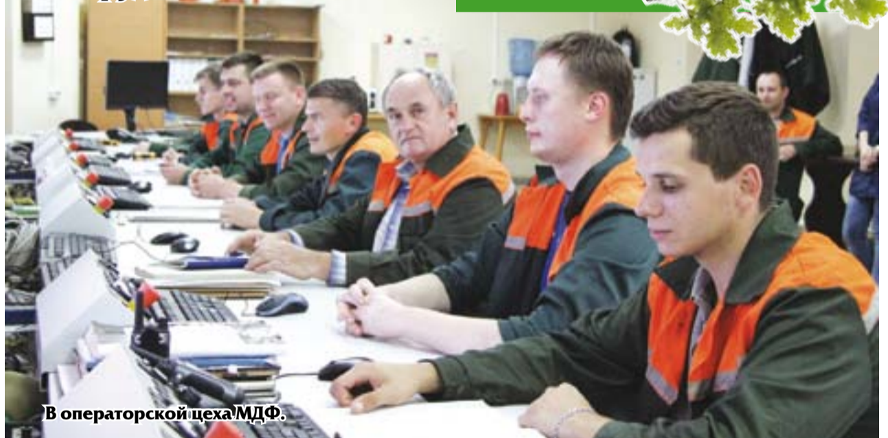
В операторской цеха МДФ.

Доля экспорта в объёме производства составила за прошлый год 90 процентов. В структуре экспорта плиты МДФ составляют 63 процента, фанера - 31,7 процента. Всего экспортировано продукции за прошлый год на 1,7 миллиона долларов США, темп роста составил - 24,9 процента. Наша продукция в прошлом году поставлялась в Литву, Германию, Польшу, Словакию, Чехию, Азербайджан, Армению, Казахстан, Россию. Больше всего продавалось продукции в Польшу - 66,1 про-