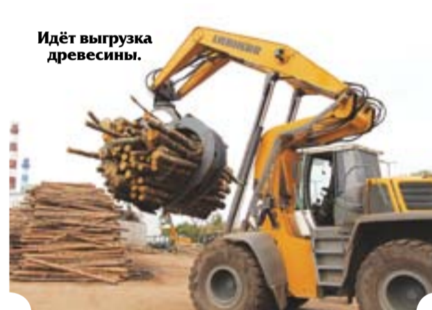
Идёт выгрузка древесины.