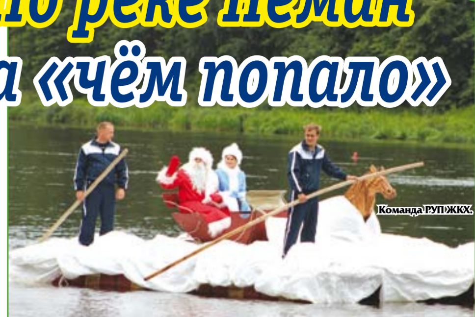
13 августа в урочище «Михайловка» в районе городского парка у спасательной станции прошёл районный спортивный праздник «Плавание «На чём попало» по реке Неман. Команда РУП ЖИХ.

Еще за пару часов до старта заплывов на самодельных плавательных средствах на берегу кипела работа. Кто-то усердно подкачивал основу своих плотов -- автомобильные шины, кто-то сбивал между собой доски.