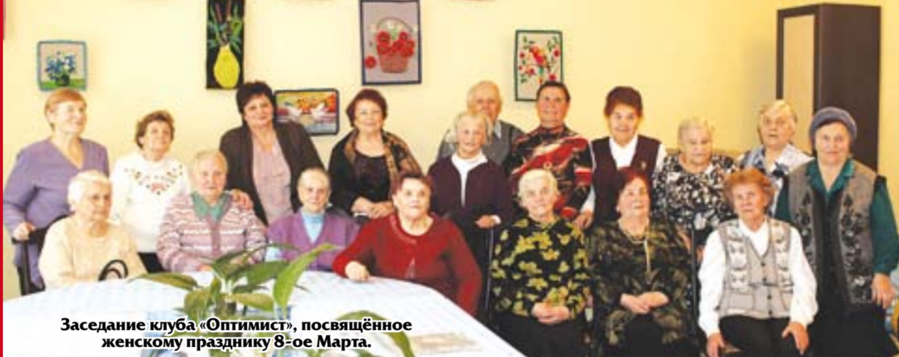
Заседание клуба «Оптимист», посвящённое женскому празднику 8-ое Марта.

После события Современные пожилые люди выступают против стандартов. Читать нотации потомкам, смотреть сериалы длиной в километры носков -- не модно и весьма скучно. Существует ли альтернатива для динамичных бабушек и дедушек? Конечно! Когда в Мостах уже как пятнадцать лет образован и действует клуб «Оптимист». 3 марта в социальной гостиной прошло заседание клуба, которое было посвящено весеннему женскому празднику 8-ое Марта.