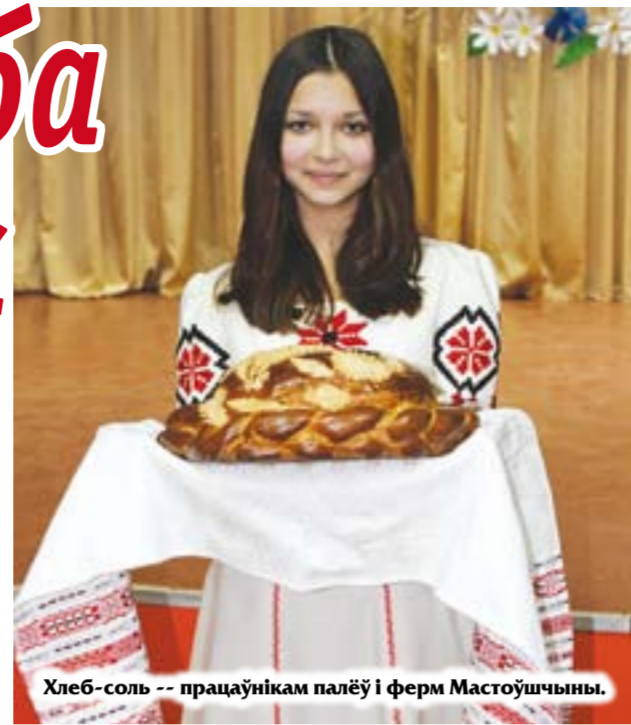
Хлеб-соль – прадаўнікам палёў і ферм Мастоўшчыны.

– Нягледзячы на ўсе цяжкасці і прыродныя катаклізмы, аграрыі Мастоўшчыны зрабілі ўсё магчымае, каб дасягнуць добрых вынікаў і дастойна адсвяткаваць сваё професійнае свята. Высокія пазіцыі займае раён у вобласці і рэспубліцы па