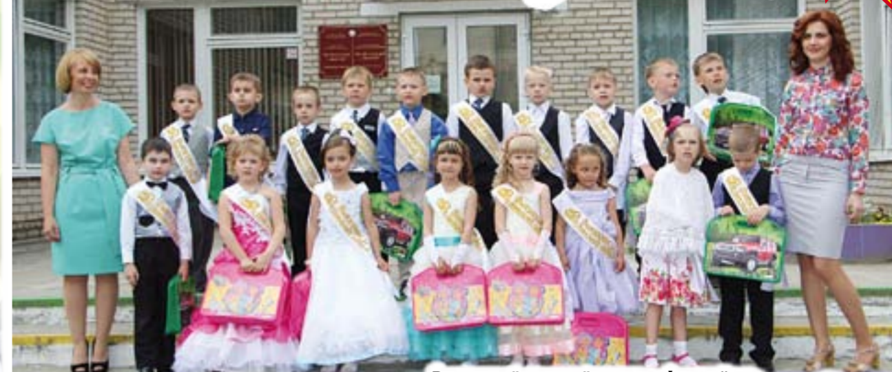
Выпускной старшей группы «Фантазёры». До свидания, наш любимый детский сад!

Взглянув на название статьи, не подумайте, уважаемые читатели, что автор решил воспользоваться талантом Пушкина или превзойти его. Что вы! Посягнуть на творения великого поэта и в мыслях не было. Речь пойдёт о детском садике «Золотой петушок», или, выражаясь официальным стилем, о дошкольном учреждении образования «Ясли-сад №4 г. Мосты». Взяться за перо давно собиралась, так как именно с этим детским садом связано несколько лет жизни (и весьма хороших лет!) моих детей.