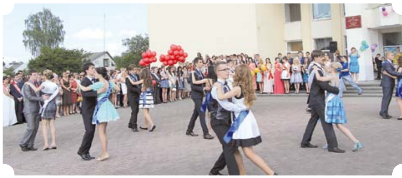
Е. ЦЕСЛЮКЕВИЧ

школьный вальс... Как бабочки над цветами, легко и восторженно порхают в танце девушки. А юноши пытаются изо всех сил казаться невозмутимыми, скрывают эмоции. Валетают в небо разноцветные шары, как символы улетающего детства... Сегодняшние выпускники завтра станут студентами, кто-то начнет работать. Это лето круто изменит их жизнь. Начнется новый её этап. Пусть он будет для нынешних юношей и девушек удачным и счастливым.