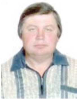
Прими тепло наших сердец,