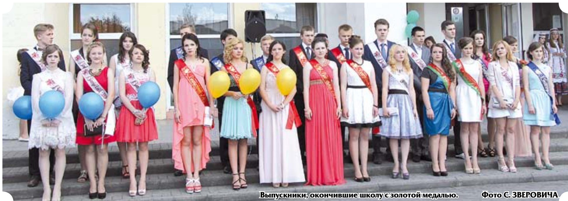
Выпускники, окончившие школу с золотой медалью.